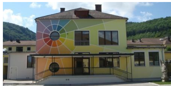
Fassade nach Abschluss des Projektes