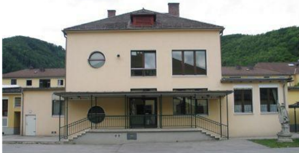
Fassade vor Projektbeginn