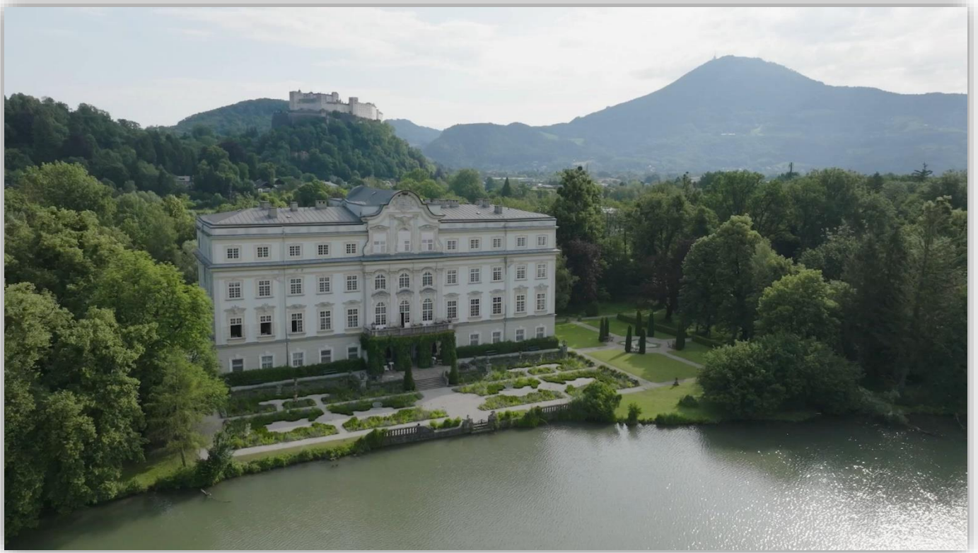
Der Austragungsort – Schloss Leopoldskron / Slzbg