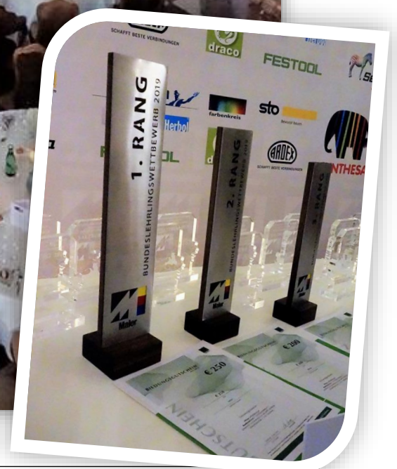
Die Siegerehrung – Schloss Leopoldskron / Slzbg