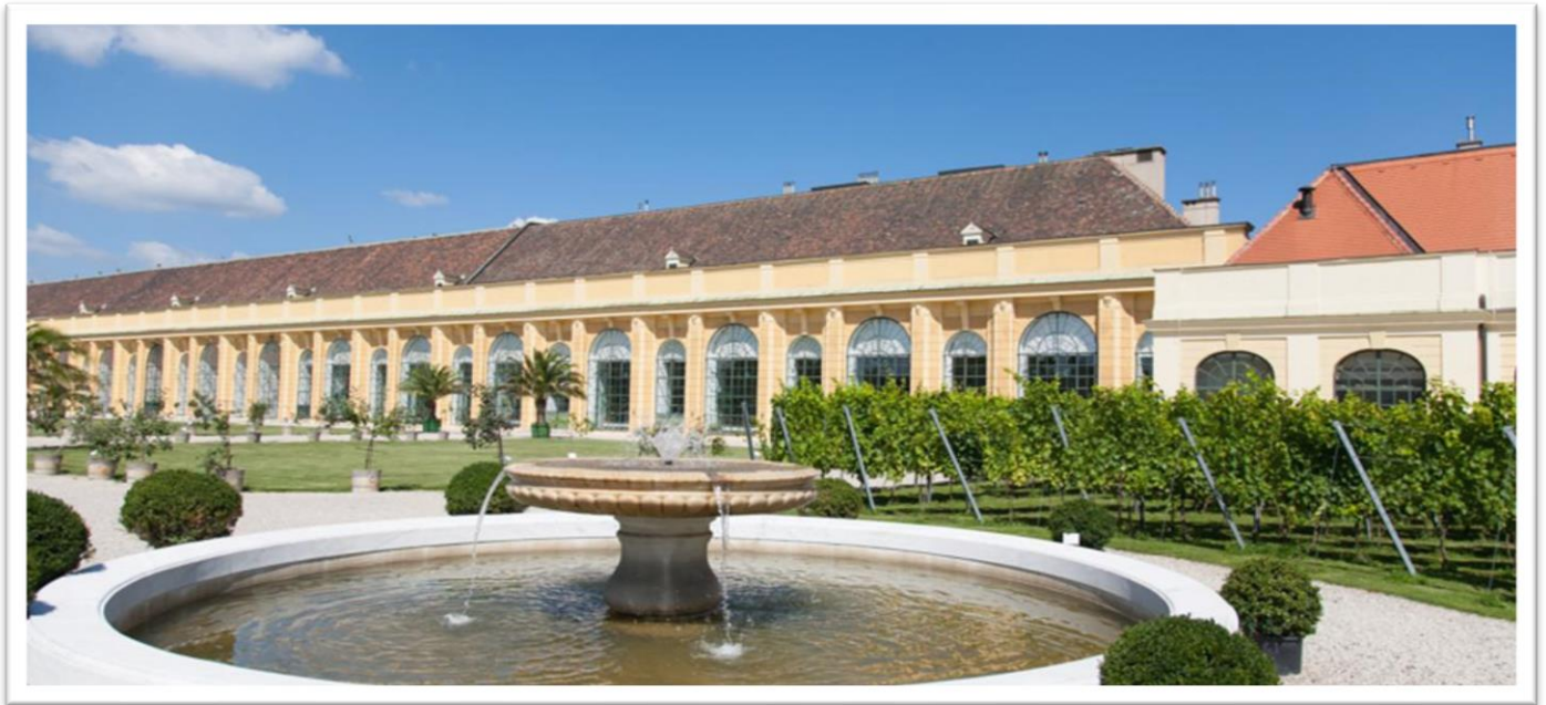
Der Austragungsort – Schloss Schönbrunn / Wien