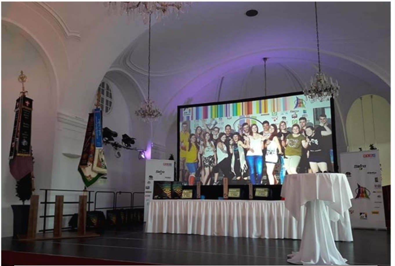
Die Siegerehrung – Schloss Schönbrunn / Wien