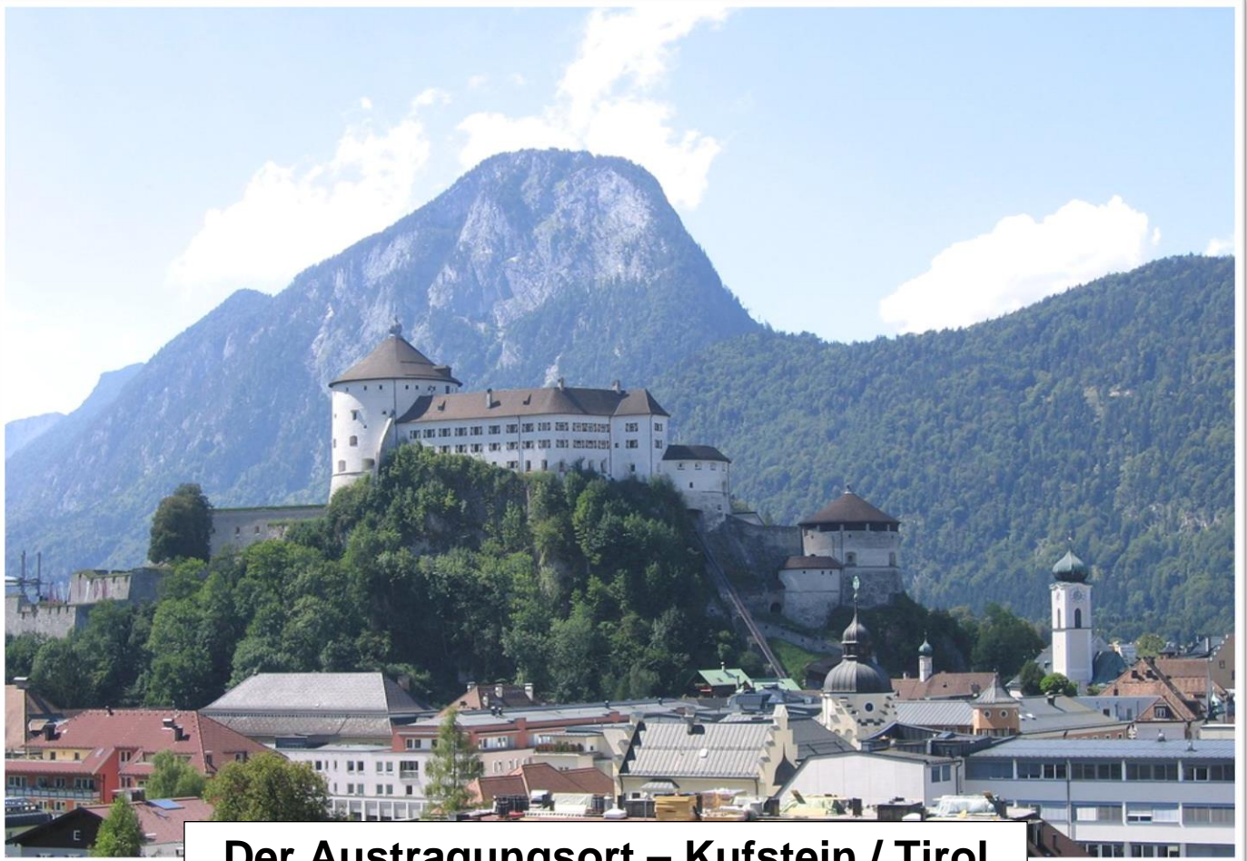
Der Austragungsort – Kufstein / Tirol