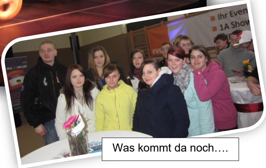
Was kommt da noch....