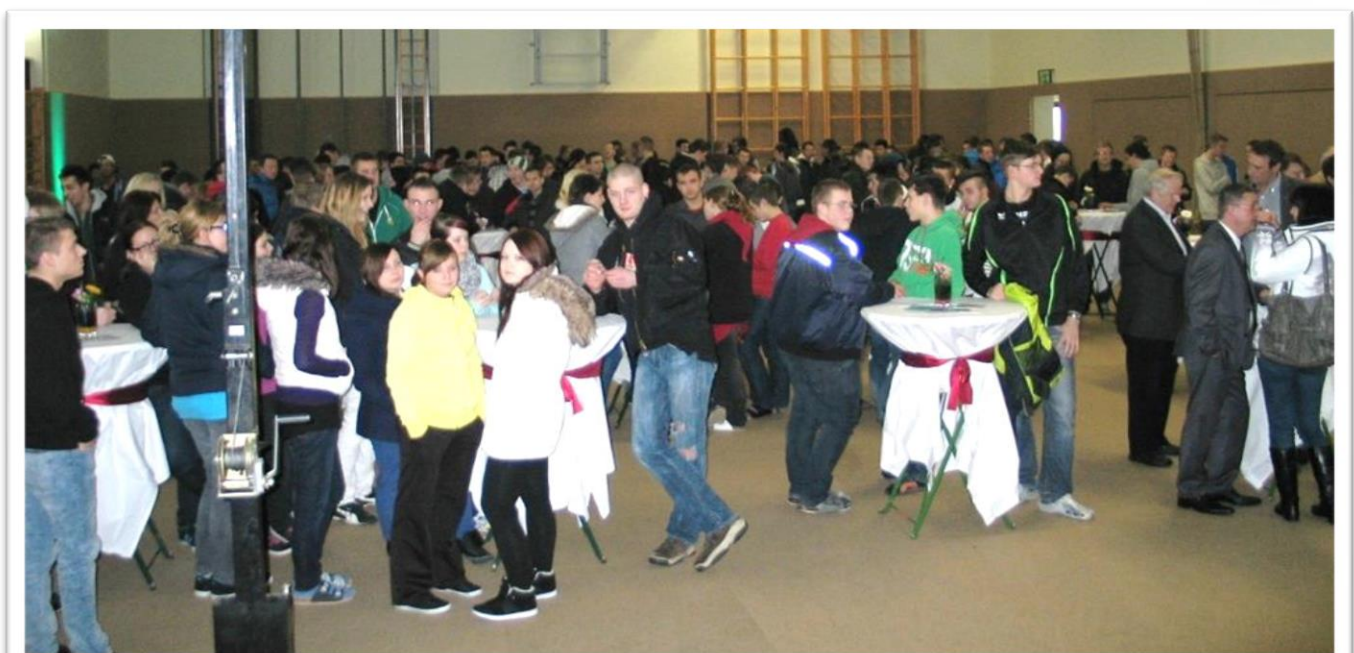
..eine gelungene Veranstaltung.