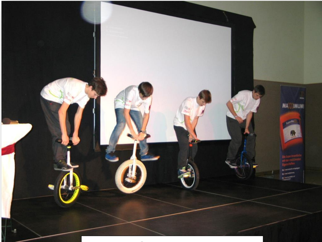
Light Spirits in Aktion