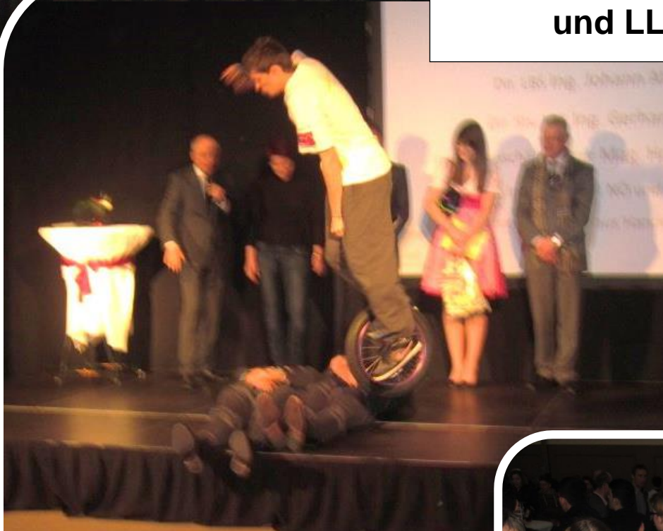
Gelingt der Sprung ..