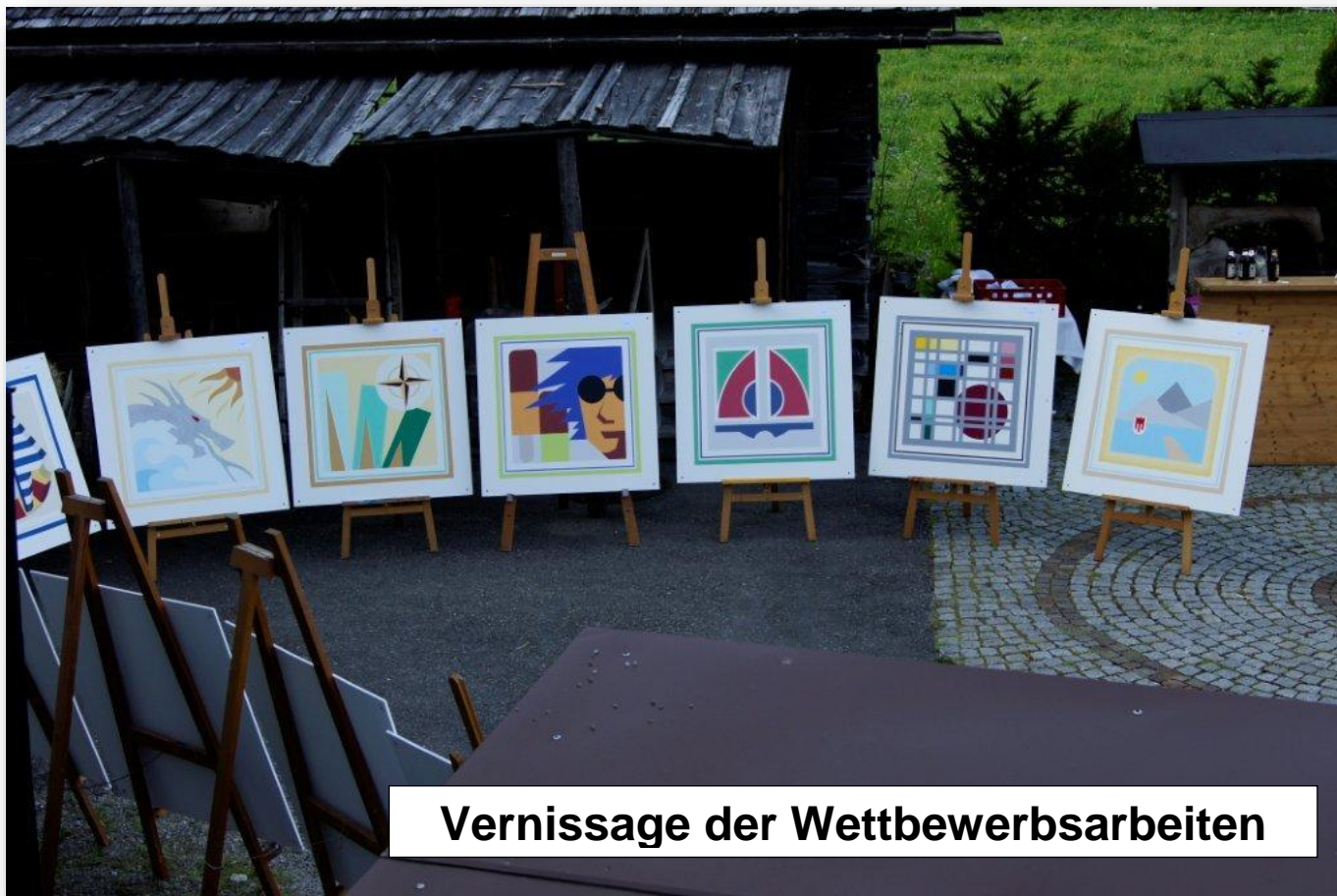
Vernissage der Wettbewerbsarbeiten