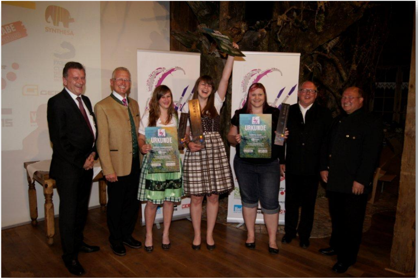
So sehen Siegerinnen aus..