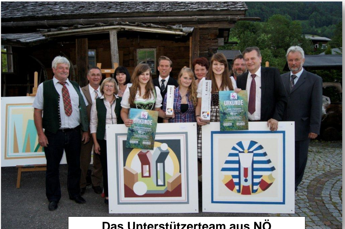
Das Unterstützerteam aus NÖ