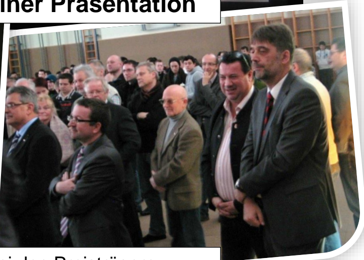
Aufmerksamkeit bei den Preisträgern, bei den Ehrengästen und den SchülerInnen